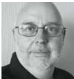
ETIENNE BURG BIBLIOTHÈQUE DE GENÈVE