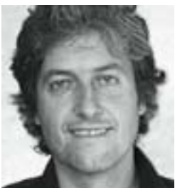
LAURENT BAUMANN MEMORIAV

An der diesjährigen Mostra Internazionale d'Arte Cinematografica di Venezia wurde ein ganz spezielles Helveticum präsentiert: die restaurierte Kopie eines verloren geglaubten Films. Seine Mutter war eine stolze Römerin. Heute wissen wir, dass sein geistiger Vater ein «gschaffiger» Thurgauer war und es auch einen Halbbruder gibt.