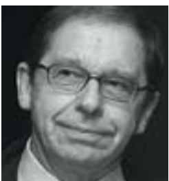
KURT DEGGELLER MEMORIAV

Die Statuten des Vereins Memoriav von 1995 haben dem Zahn der Zeit gut widerstanden, besonders, wenn man bedenkt, wie rasant sich die audiovisuelle Technologie in den 16 Jahren entwickelt hat. Einzig das erklärte Ziel, das audiovisuelle Kulturgut zu erfassen, scheint eine Sisyphusarbeit zu bedeuten.