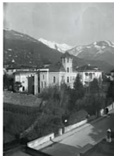
Das Elisarion kurz nach 1939 (mit der Rotunde), Glasnegativ.

Früher als erwartet wurde diese nun realisiert – und erst noch am Ort des Geschehens. Der Zufall will es, dass gleichzeitig mit dem Abschluss der Restaurierungsarbeiten das «Centro Culturale Elisarion» sein 30-jähriges Bestehen feiert und die Gemeinde Minusio uns – die Begründer und Verantwortlichen des oben genannten Vereins – eingeladen hat, zusammen mit der Gemeinde eine Ausstellung zu realisieren. Sie ist am 16. September eröffnet worden und dem Andenken Harald Szeemanns gewidmet.