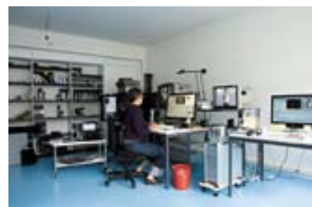
Schweizer Tanzarchiv, Abteilung für Videokonservierung, Zürich