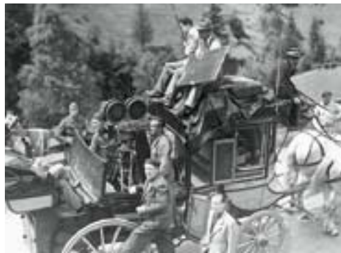
Drehaufnahmen von «Der letzte Postillon vom St. Gotthard».