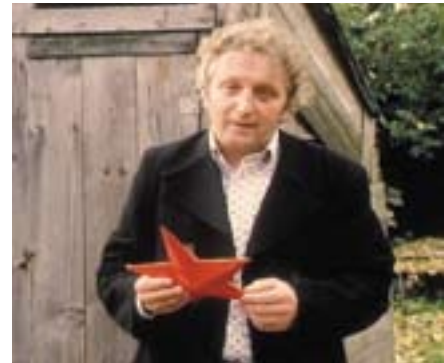
Peter Bichsel in einem Schauplatz-Beitrag von 1980 zum Abstimmungskampf ums Kulturprozent.

Auch audiovisuelle Bestände sind im Schweizerischen Literaturarchiv zu finden. Der Zugang zu diesen Dokumenten wird über das Online-Inventar www.imvocs.ch ermöglicht.