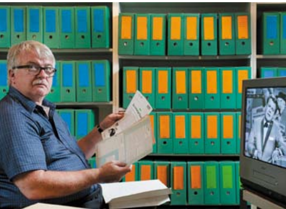
Die Sammlung umfasst weit über 500 Archivschränke mit Dokumenten zur Schweizer Kleinkunstszene.

ge Forscher erinnern. «Meine Frau versorgte sie mit belegten Broten, und am Schluss wurden diese in der Arbeit verdankt und nicht das Archiv», kommentiert von Allmen mit trockenem Humor.