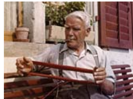
Screenshot aus «Mensch und Maschine» von Adolf Forster, 1955.

In seiner Zweckgebundenheit unterstreicht der Auftragsfilm die Dimensionen der Verwendung und des Konsums von Filmen. Hierin war die Schweiz stets sehr international: Unternehmen, Verbände und Organisationen wie die Schweizerische Arbeiterbildungszentrale setzten oft überwiegend ausländische Filme zur Unterhaltung, Erziehung und Weiterbildung des heimischen Publikums ein. In Nestlés Fip-Fop-Club , der die frühesten Film- und Kinoerfahrungen mehrerer Generationen von Kindern und Jugendlichen prägte, waren Charles-Chaplin-Filme der absolute Renner. Und selbst die Unterrichtsfilme, die in Schweizer Klassenzimmern liefen, stammten mehrheitlich aus ausländischer Produktion. Ungeachtet ihrer nationalen Herkunft waren diese Filme eingebunden in schweizerische Alltagspraxis, formten Ansichten und Einstellungen und gingen ins kollektive Gedächtnis ein. Nach heutiger, auf Kriterien der Produktion basierender Definition von Helvetica, gehören sie jedoch nicht zum audiovisuellen Kulturgut der Schweiz. Auftragsfilme regen nicht zuletzt dazu an, über eine Erweiterung der Auslegung von Helvetica um das Kriterium des Gebrauchs von Filmen innerhalb der nationalen Grenzen nachzudenken.