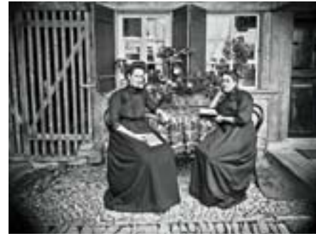
Lesende Frauen, um 1915.

Aus einem Pilotprojekt im Kanton Bern, das 2004 startete, entwickelt sich seit 2009 «fotoCH | photoCH». Herausgegeben vom Fotobüro Bern beinhaltet das Online-Nachschlagewerk gleichzeitig ein Lexikon, das Angaben über Fotoschaffende vermittelt, und ein Repertorium, das über Fotobestände informiert. Dank der Zusammenarbeit einerseits mit MemoriaV, andererseits mit der Schweizerischen Ethnologischen Gesellschaft wird «fotoCH | photoCH» im Bereich des Repertoriums – nebst dem kontinuierlichem Ausbau des Lexikons – in den nächsten drei Jahren einen markanten Datenzuwachs erfahren. In separaten Projekten werden die Informationen aus der MemoriaV-Erhebung und aus «L'objectif subjectif» eingearbeitet und im Kontakt mit den Bestandeseignern korrigiert und aktualisiert.