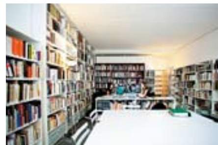
Collection suisse de la danse, Lausanne Foto: Gregory Batardon

Manchmal machen uns die vielen Videokassetten, die in Zürich und Lausanne stehen, Sorgen, denn viele sind leider dem Verfall der Zeit geweiht – obschon auf diesen noch viele Schätze der Tanzkunst zu entdecken wären. Gemeinsam mit Memoriav stellen wir uns dem Wettlauf gegen Zeit und Geldnöte, denn für den Tanz ist das bewegte Bild die einzig adäquate Art, das immaterielle Kulturgut Tanz zu bewahren.