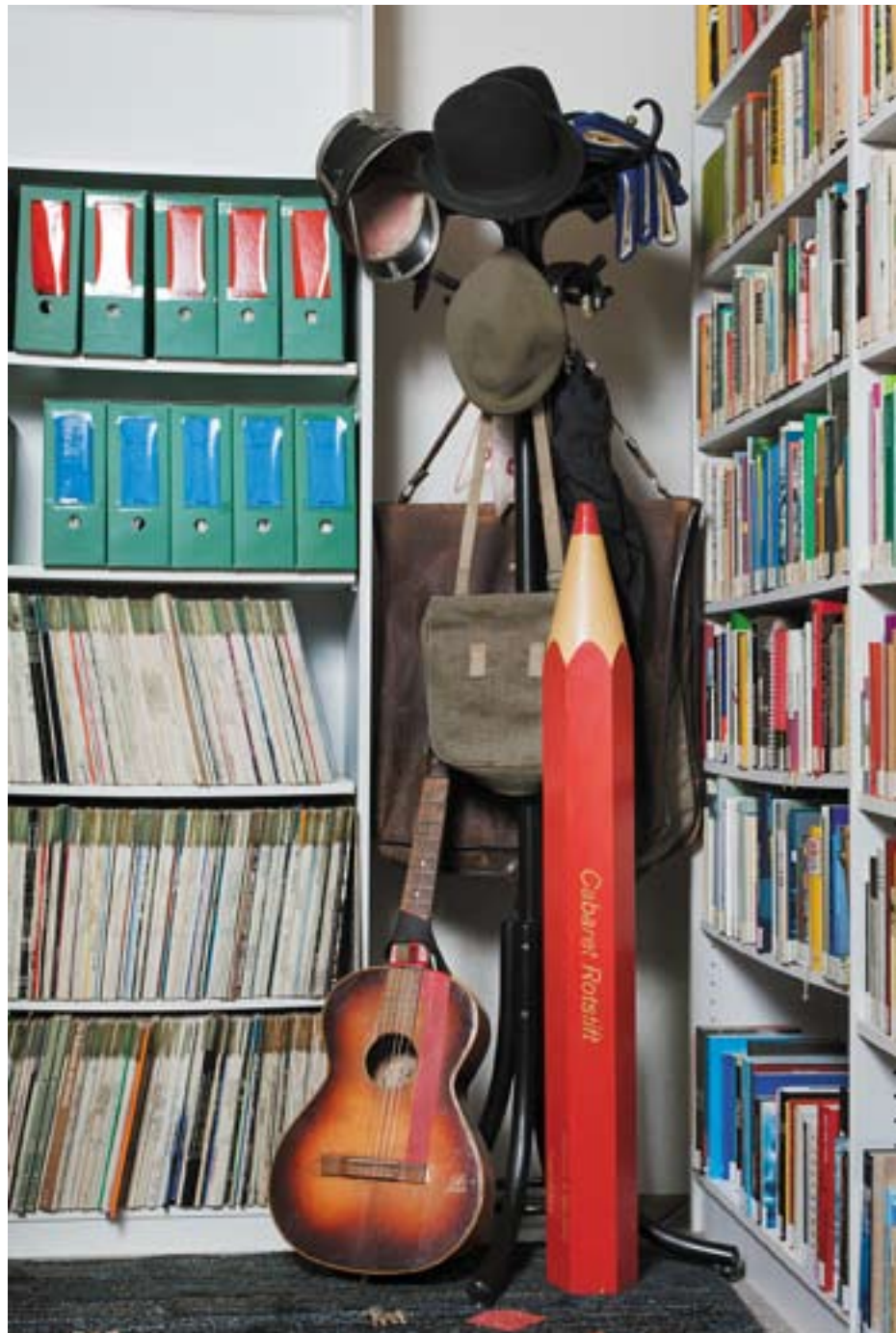
Originalrequisiten.