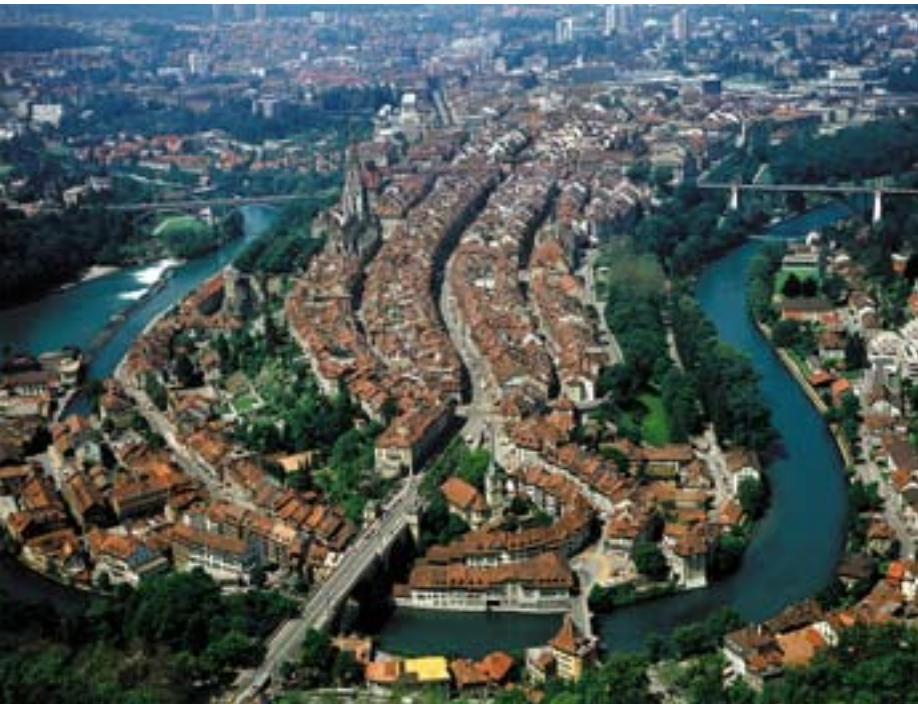
Luftaufnahme der Altstadt von Bern mit Aare, 1977.