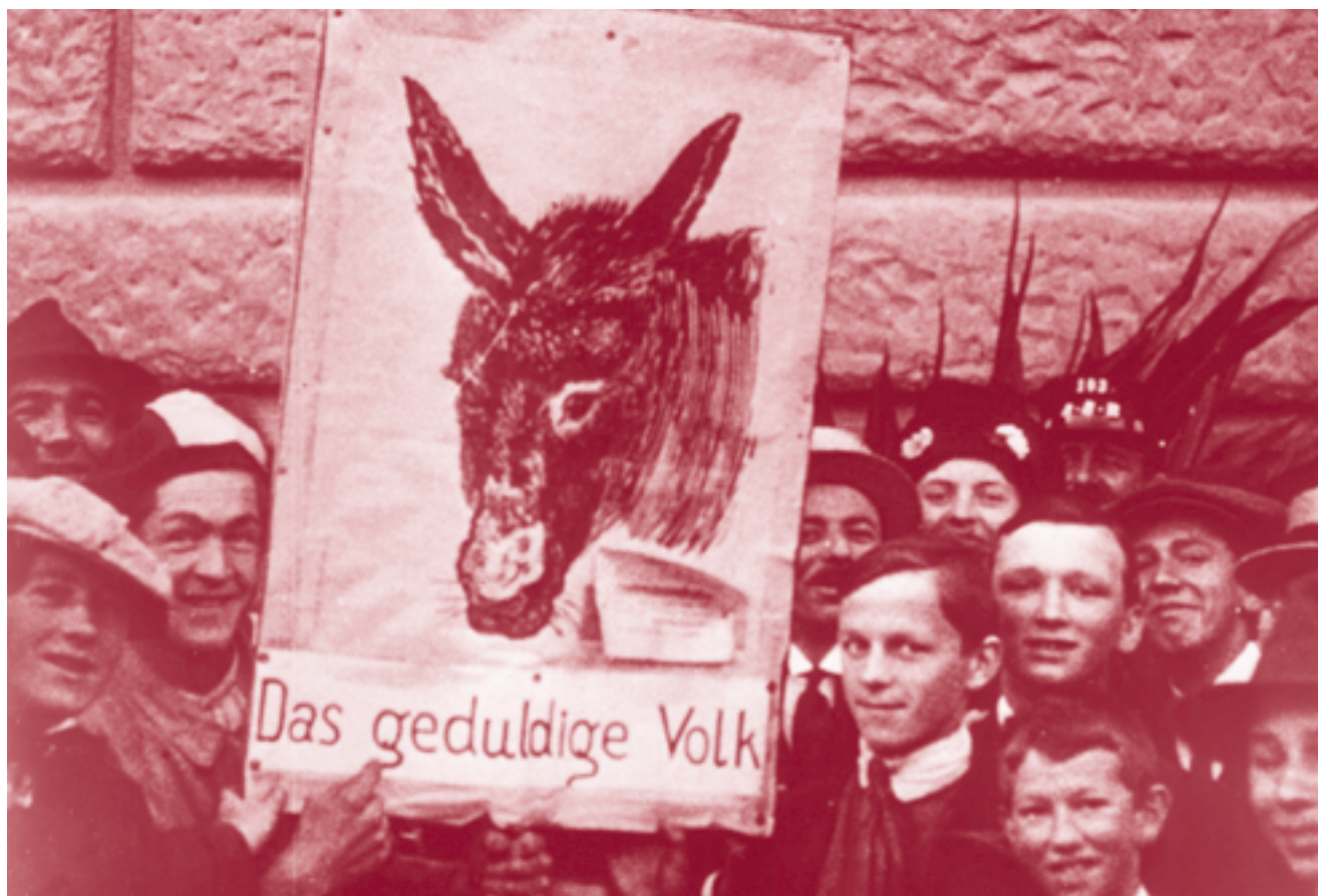
Berna, 30 agosto 1917: Lavoratori e lavoratrici protestano contro il rincaro e la riduzione dei salari.