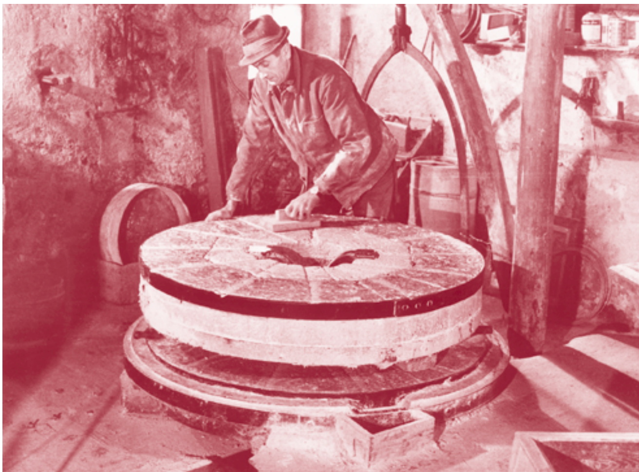
«Le moulin Develey sis à la Quielle» (1971) de Claude Champion: un des films du Fonds de la Société suisse des traditions populaires, aujourd'hui sauvé et conservé à la Cinémathèque suisse.

Last but not least, Memoriav s'est dotée d'un «label» qui accompagnera dorénavant tous les documents conservés grâce à son soutien. Ce label aidera à faire connaître les projets de Memoriav et à faire prendre conscience au public que d'innombrables œuvres précieuses appartenant à la mémoire collective de notre pays sont menacées et doivent être sauvées. Le logo doit également servir de label de qualité, garantissant que les documents ont été conservés selon des normes éthiques et techniques.