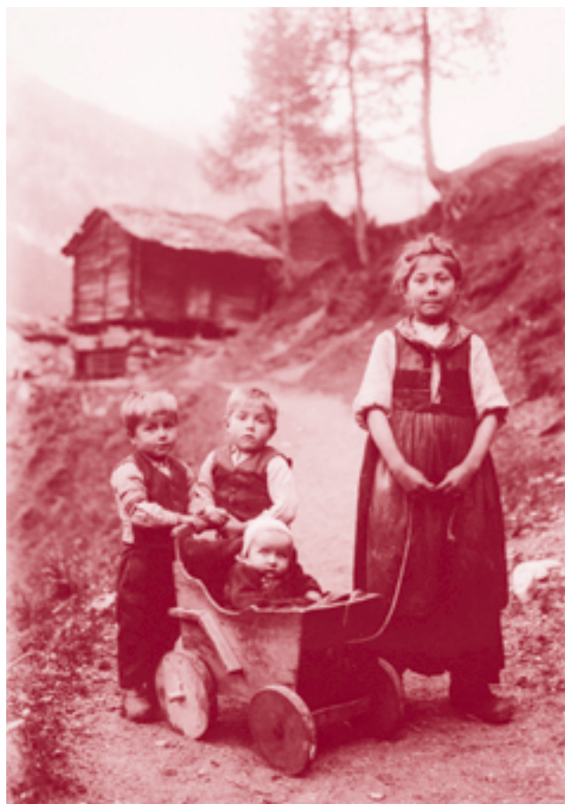
«Les enfants de Lannaz» di Jacques Lüscher, Nyon: Una fotografia rievocata dal progetto «La vita quotidiana nel corso del tempo» (v. bulletin 6 e 7/2000).

La ricerca in Memobase non è paragonabile con quella che si effettua nelle banche-dati tradizionali, ma piuttosto con quella usata su World Wide Web. Questo potrebbe