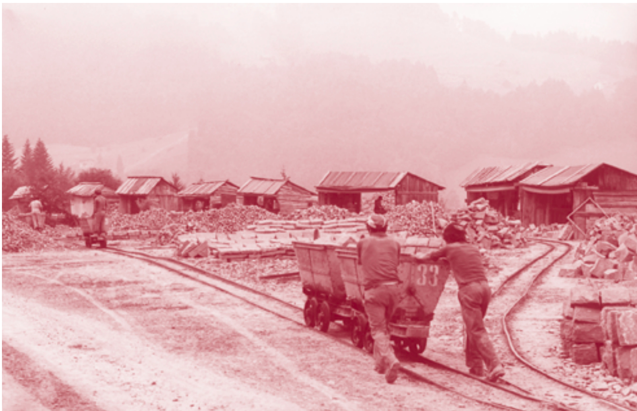
Il film «Guber – Arbeit im Stein» (1979) di Hans-Ulrich Schlumpf fa parte del Fondo della Società Svizzera per le Tradizioni Popolari salvaguardato con il sostegno di Memoriav.