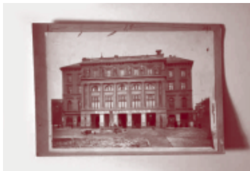
SLB / Tag des audiovisuellen Gedächtnisses, 24.9.2001, Theater und Museumsrestaurant, Bern