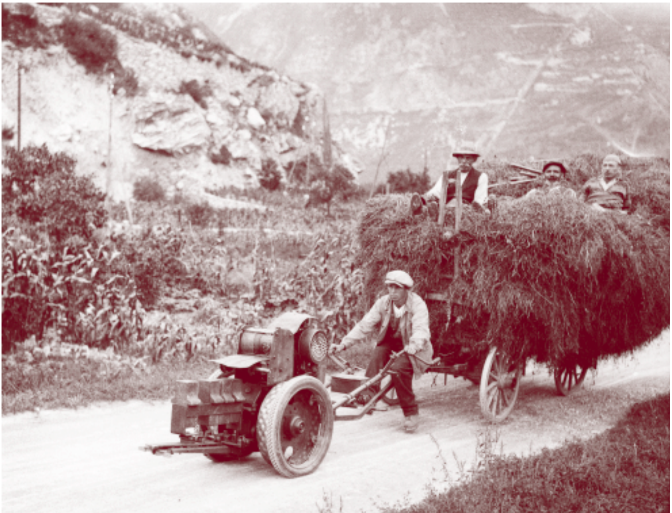
«La vie quotidienne au fil du temps»

Des études sont aussi en cours pour élargir le même système de consultation aux autres supports audiovisuels. En définitive donc une expérience passionnante qui, nous l'espérons, va révéler encore de bonnes surprises tant sur le plan des documents mis à la portée du public que dans les développements techniques et scientifiques de leur traitement.