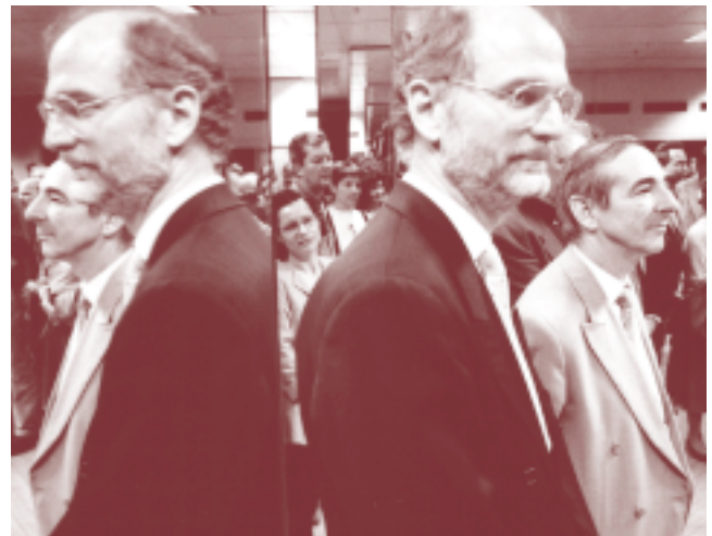
Vernissage «Au fil du temps», Martigny

die Médiathèque Valais – Image et Son in Martigny, mit der Fotoausstellung «Au fil du temps – Im Laufe der Zeit», vom 11. Mai bis 28. Oktober 2001, und bis November verlängert.