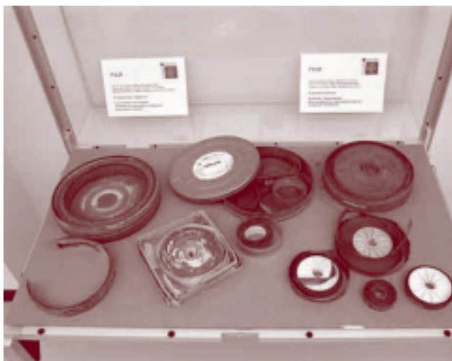
SLB / Tag des audiovisuellen Gedächtnisses, 24.9.2001, Vitrine Film

Accès: La base est accessible à l'adresse suivante (Internet Explorer est requis): www.sn1.ch/posters