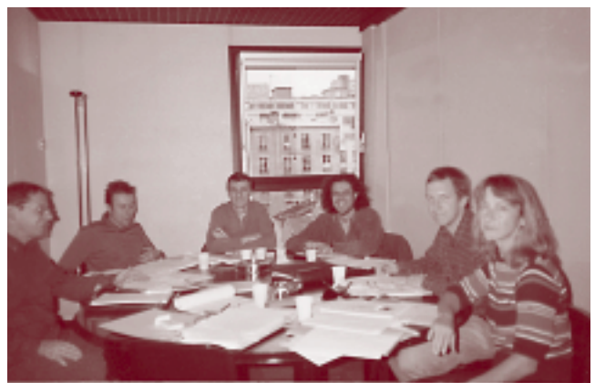
Rencontre des «Content Providers» de ECHO, le 26. 11. 2001 à Paris