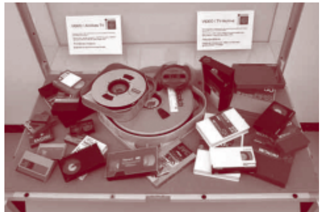
BN / Journée de la mémoire audiovisuelle, 24.9.2001, la vitrine des supports vidéo

Verfügbarkeit der Dokumente: Schweizerisches Bundesarchiv, Bern; SRG SSR idée suisse.