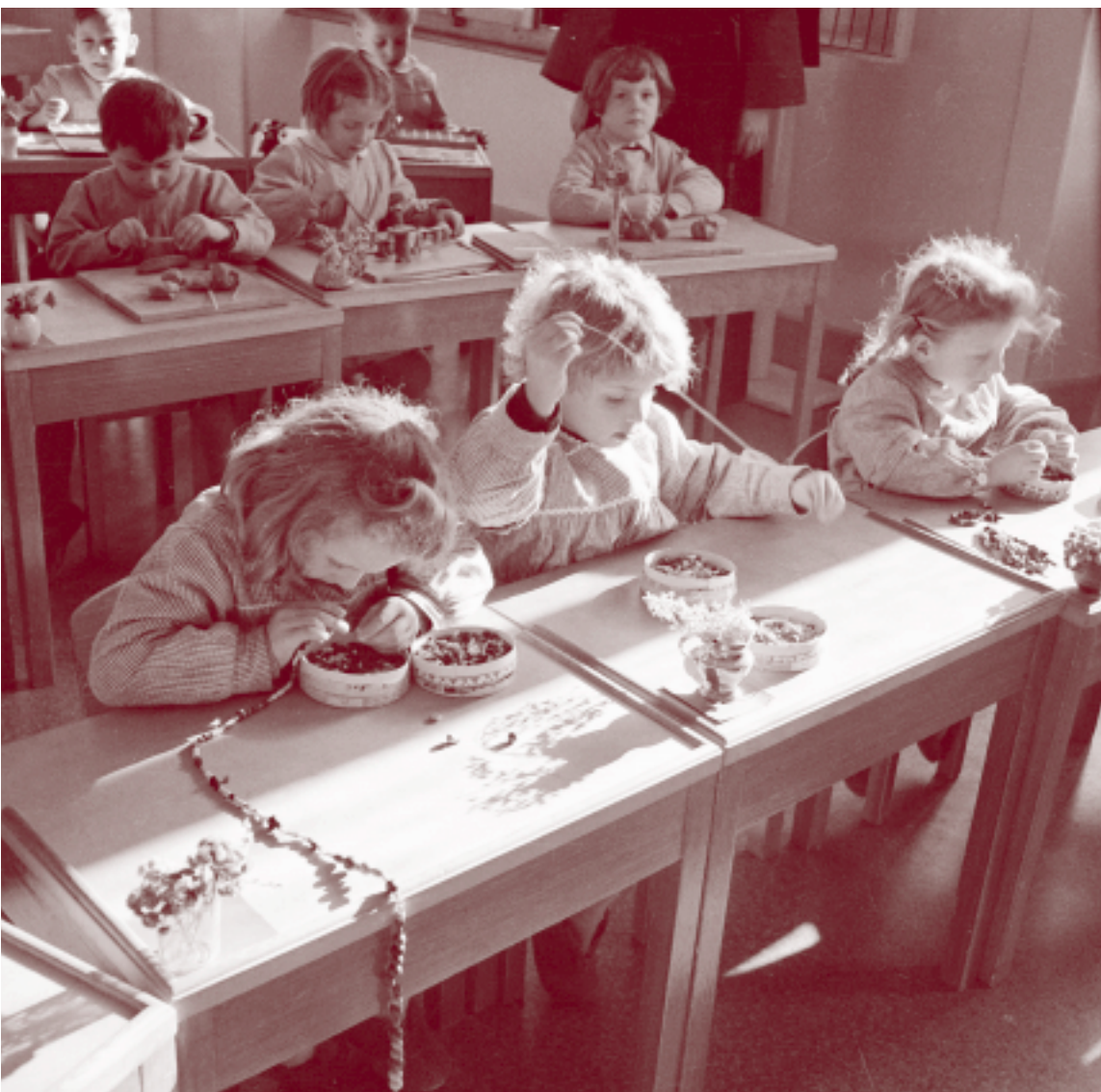
«Das Alltagsleben im Laufe der Zeit» Sainte-Jeanne-Antide, Martigny, 1950