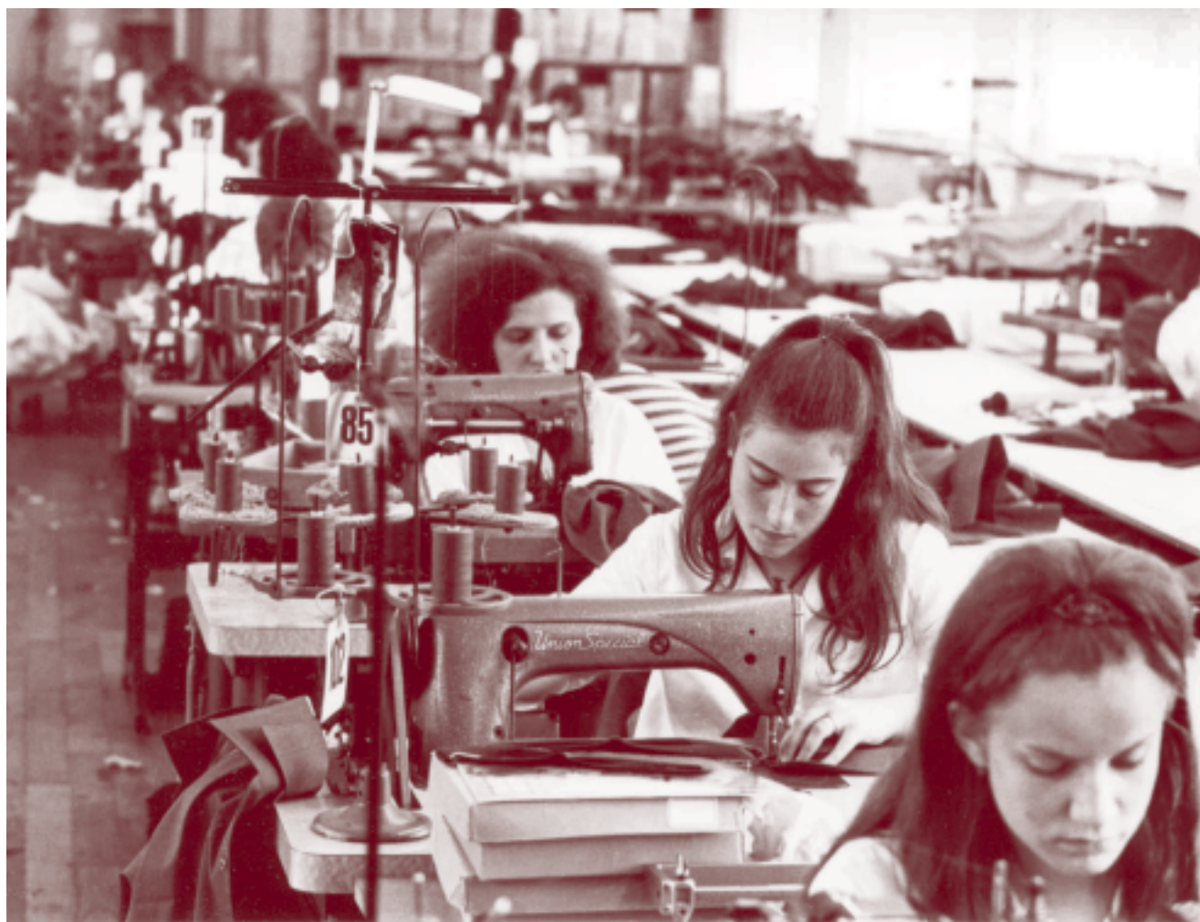
Il tema del lavoro nella serie «Réalités suisses»: «Ragazze alle macchine da cucire nella fabbrica di camicie», da un reportage nella valle Blenio che il fotografo Rob Gnant ha realizzato nell'agosto del 1968

Queste raccolte sono attualmente accessibili al grande pubblico nelle sale di lettura dell'Archivio federale. I dati di riferimento e in parte i documenti possono anche essere consultati attraverso la banca dati Memobase sul sito web www.memoriav.ch .