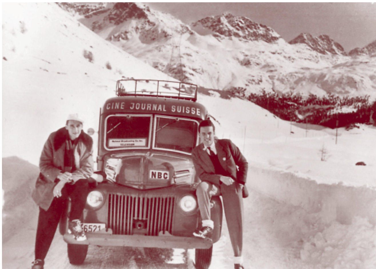
Nella serie «Erlebte Schweiz – Réalités suisses» sono stati mostrati e commentati documenti audiovisivi di «Informazione politica». Cinegiornale svizzero (1940–75). A sinistra: Cameraman G. Bartels