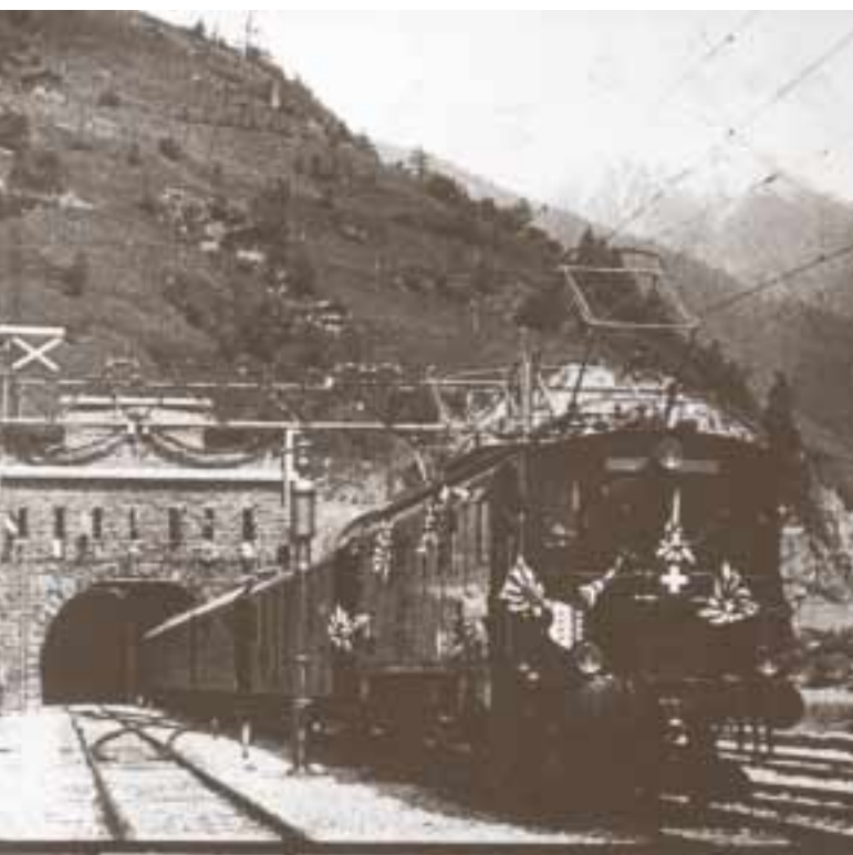
Image du film muet «Fahrt mit der Lötschbergbahn», Production: Eclipse 1913

Le chemin de fer, moyen de transport qui a révolutionné le trafic et le commerce; le chemin de fer, trait d'union entre les localités et lien entre les humains dans leur vie quotidienne et pendant leurs vacances; le chemin de fer, milieu de travail qui a marqué l'éthique de toute une catégorie professionnelle, mais aussi produit esthétique, qui inspire depuis un siècle et demi les industriels et les designers. En un mot comme en cent: les chemins de fer font partie de notre histoire et de notre identité – et tous ces éléments se retrouvent conservés par le son et l'image. De plus, comme l'histoire du chemin de fer a pratiquement le même âge que l'histoire de la photographie, qui a, de son côté, inauguré une ère nouvelle dans la reproduction visuelle, en donner un reflet par l'audiovisuel est d'autant plus excitant.