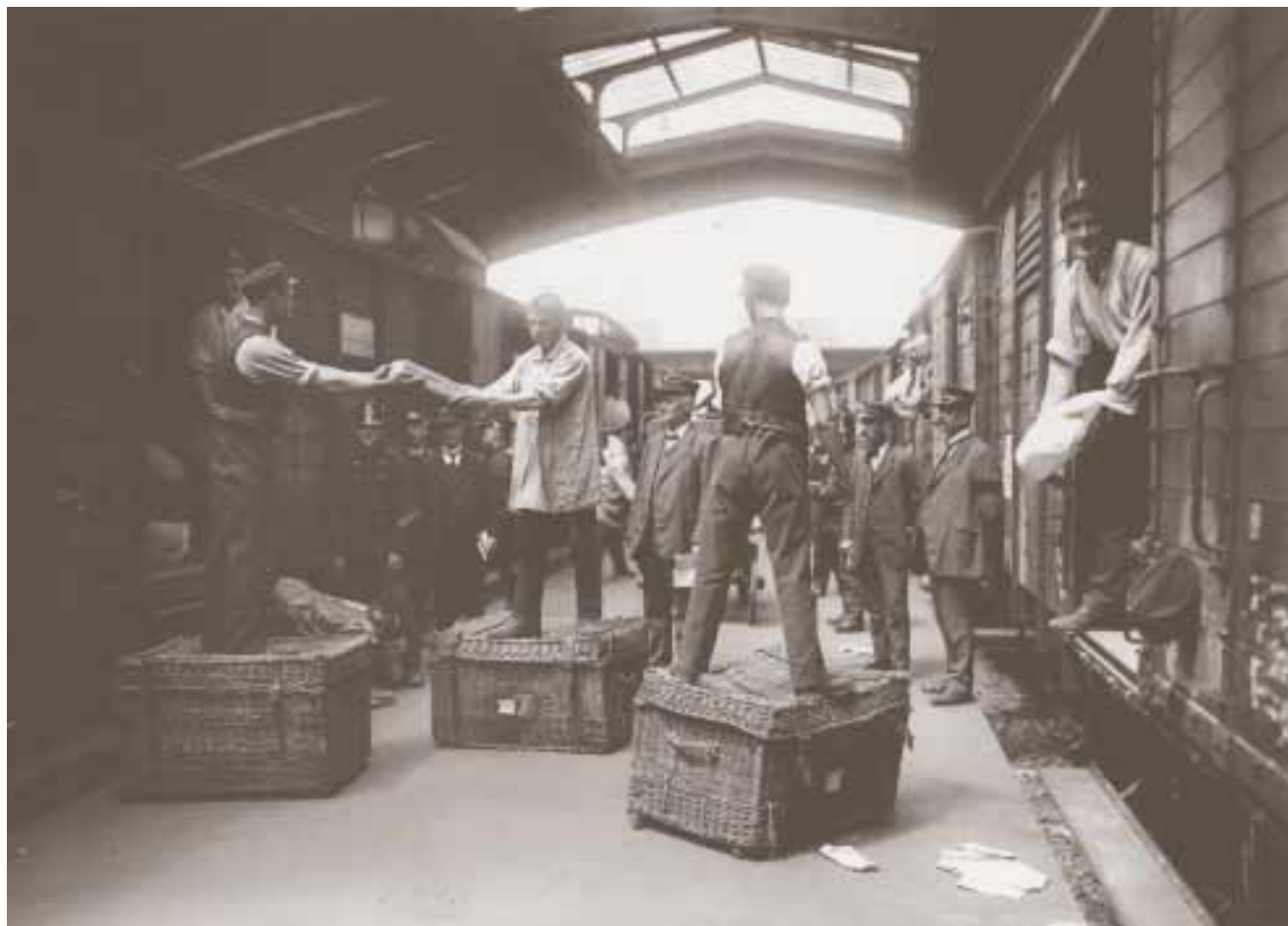
Soldaten im Bahnhof Basel, zwischen 1914 und 1918.

Die Eisenbahn als Transportmittel, das Verkehr und Handel revolutioniert hat, die Eisenbahn als Verbindung zwischen Orten und Menschen im Alltag und in den Ferien, die Eisenbahn als Arbeitsort, der die Ethik einer