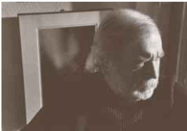
Jacques Chessex, uno degli autori inclusi nel progetto IMVOCS