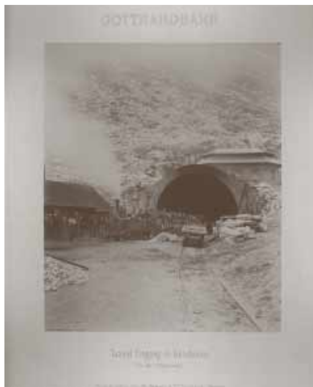
Foto che illustra la costruzione della galleria del San Gottardo, «Tunnel Eingang in Göschenen (Vor der Vollendung)»

In conclusione, il pubblico ha potuto conoscere i progetti portati avanti in collaborazione con la Biblioteca nazionale. Si tratta di VOCS (voix de la culture suisse), del CD-ROM sull'opera di Dürrenmatt «Die Physiker» e del progetto «Catalogo svizzero dei manifesti».