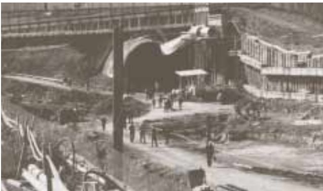
Il Cantiere della NFTA a Frutigen, dov'è stato presentato un montaggio video con film sul tema delle gallerie