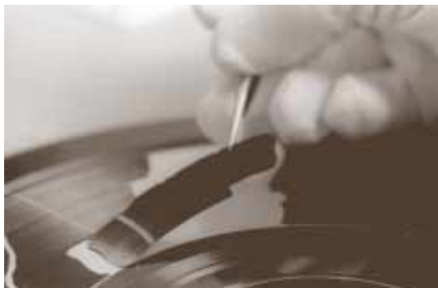
Restaurieren einer beschädigten 78-T-Platte vor dem Umkopieren.

Die originalen 78-T-Platten von SRG SSR idée suisse wurden in die Schweizerische Landesbibliothek nach Bern verlagert, denn ihr Zustand verschlechtert sich schnell, und die Studios haben immer weniger Platz, um die Dokumente sicher aufzubewahren. Die Schweizerische Landesphonothek kontrolliert, ob durch die Klimatisierung in der Landesbibliothek der Zerfallsprozess gestoppt oder verlangsamt werden kann.